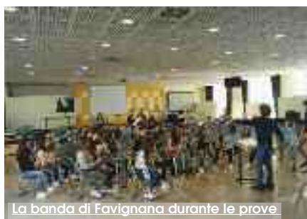
La banda di Favignana durante le prove

Il sindaco delle Isole Egadi, Giuseppe Pagoto si è complimentato con la Banda e l'intera comunità egadina per il successo ottenuto. Al Concorso nazionale, infatti, hanno partecipato 19 gruppi provenienti da tutta Italia, di cui 8 nella categoria A, in cui era prevista l'esecuzione di brani con il maggior grado di difficoltà. La PicoBandAgain, composta da 45 giovani, è stata diretta dal maestro Arturo Andreoli, che ha guidato il gruppo nell'esecuzione di due brani: quello d'obbligo, "Butterfly Island", dedicato all'isola di Favignana, e quello a scelta,