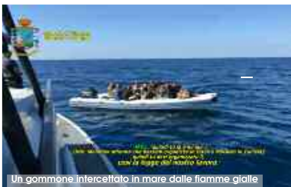
Un gommoni intercettato in mare dalle fiamme gialle

Gommoni veloci sulla rotta delle sigarette di contrabbando, dalle coste del Nord Africa alle spiagge di Marsala. Individuata dalla Guardia di Finanza una organizzazione transnazionale di cui fanno parte cittadini italiani, tunisini e marocchini. Per 13 di loro la Procura di Palermo ha disposto il fermo, la cui esecuzione è stata affidata ieri ai finanzieri del nucleo di Polizia economico-finanziaria di Palermo e della compagnia di Marsala. I fermati avrebbero organizzato almeno tre le traversate, tutte intercettate dal Reparto aeronavale delle fiamme gialle che in collaborazione con i colleghi del comando provinciale e delle compagnie territoriali ha bloccato sulle spiagge marsa-