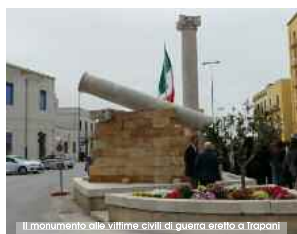
Il monumento alle vittime civili di guerra eretto a Trapani

in quanto erano stati avvistati aerei nemici ma si trattava di aerei da ricognizione. Invece intorno alle 15.20 si scatenò il caos. Molteplici le squadriglie di fortezze volanti che si scagliarono sulla città sganciando migliaia di bombe di grosso calibro e altamente esplosive. Possiamo solo immaginare in quale scenario di distruzione e morte le persone terrorizzate dovettero agire per cercare di portarsi in salvo. Le bombe cadute nel mare di Tramontana, così come quelle che caddero nei pressi della chiesa del Purgatorio, avevano come obiettivo 7 navi da guerra, tra cacciatorpediniere e torpediniere, che avevano il compito di scortare le navi cariche di armamenti, viveri e scorte, verso l'Africa ma che non vennero colpite. L'area urbana più colpita fu quella compresa tra piazza Scarlatti e la stazione ferroviaria. Il quartiere più colpito dalle bombe fu quello di san Pietro, abitato soprattutto da famiglie di marinai, che venne praticamente raso al suolo, qui si consumò l'ecatombe: le macerie arrivavano addirittura all'altezza del secondo piano e molti furono coloro che rimasero schiacciati. Uno degli scenari più raccapriccianti fu piazza Scarlatti: qui infatti c'era una cucina da campo militare e i soldati che lì si trovavano furono disintegrati,